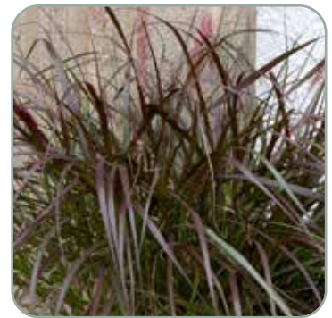
Pennisetum adv. Chelsea 'Lampepudsergræs' Højde: 50-80 cm Blomstrer juli - august Skal vinterdækkes