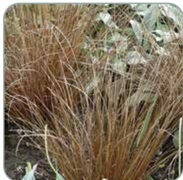
Carex Buchananii Red Rooster

Højde: 30-50 cm Blomstrer juli - august Fullt vinterhårdfør