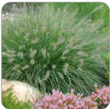
Pennisetum Alopecu. Hameln 'Lampepudsergræs' Højde: 30-50 cm Blomstrer august - oktober Skal vinterdækkes