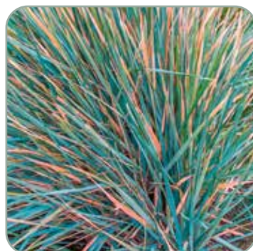
Festuca 'Elijah Blue' 'Bjørnegræs'

Højde: 60 cm Blomstrer august - oktober Skal vinterdækkes