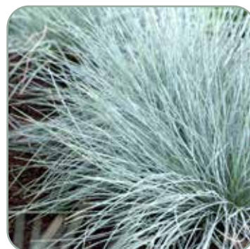
Festuca Glauca 'Bjørnegræs'

Højde: 20-25 cm Blomstrer juni - juli Fullt vinterhårdfør