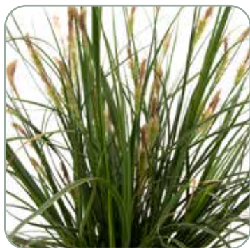
Carex oshimensis Everlime

Højde: 30-50 cm Blomstrer sjældent Skal vinterdækkes