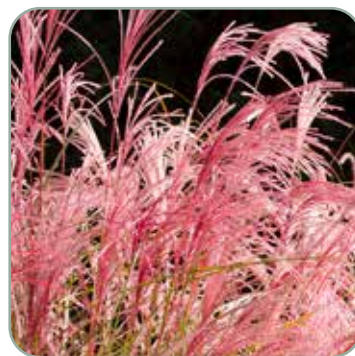
Cortaderia selloana Rosea 'Pampasgræs'

Højde: 40 cm Blomstrer sjældent Skal vinterdækkes