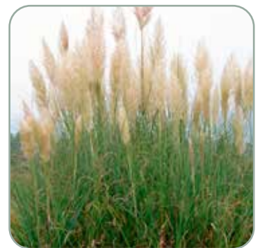
Cortaderia selloana Pumila 'Pampasgræs'

Højde: 100 cm Blomstrer august - oktober Skal vinterdækkes