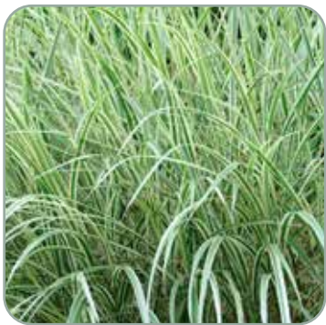
Miscanthus S. Variegatus 'Elefantgræs' Højde: 150-180 cm Blomstrer sjældent Skal vinterdækkes