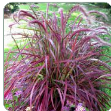
Pennisetum ori. Fireworks 'Lampepudsergræs' Højde: 50-80 cm Blomstrer juli - august Skal vinterdækkes