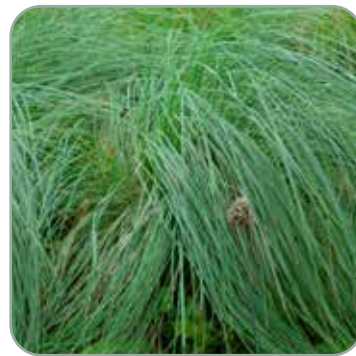
Muhlenbergia rigens Hjortegræs Højde: 60-80 cm Blomstrer august - oktober Fuldt vinterhårdfør