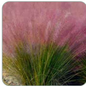
Muhlenbergia capillaris Pink Muhly Grass Højde: 60-90 cm Blomstrer august - oktober Fuldt vinterhårdfør