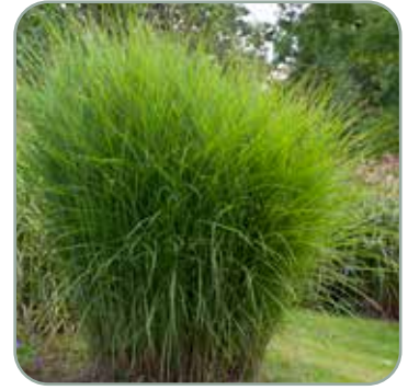
Miscanthus sinensis 'Gracillimus' 'Elefantgræs' Højde: 120-150 cm Blomstrer sjældent Fuldt vinterhårdfør