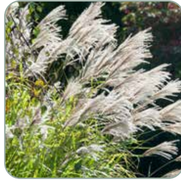
Miscanthus 'Graziella' 'Elefantgræs' Højde: 120-150 cm Blomstrer august - oktober Fuldt vinterhårdfør