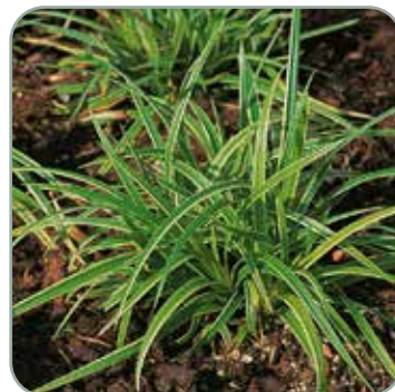
Carex Ice Dancer

Højde: 30-50 cm Blomstrer sjældent Skal vinterdækkes