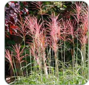
Miscanthus sin. Malepartus 'Elefantgræs' Højde: 100-200 cm Blomstrer august - oktober Fuldt vinterhårdfør