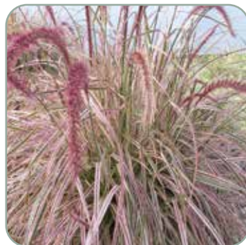
Pennisetum Ori. Cherry Sparkler 'Lampepudsergræs' Højde: 50-80 cm Blomstrer juli - august Skal vinterdækkes