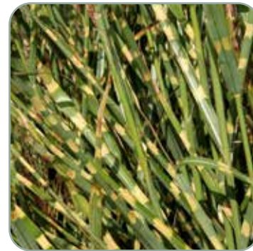
Miscanthus sinensis 'Strictus' 'Elefantgræs' Højde: 100-200 cm Blomstrer august - oktober Fuldt vinterhårdfør