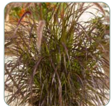
Pennisetum setaceum Rubrum 'Lampepudsergræs' Højde: 50-100 cm Blomstrer juli - august Skal vinterdækkes