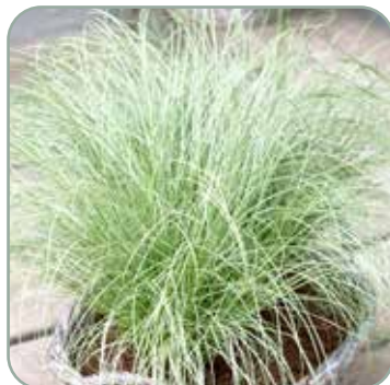
Carex oshimensis J.S Greenwell

Højde: 30-50 cm Blomstrer juli - august Fullt vinterhårdfør