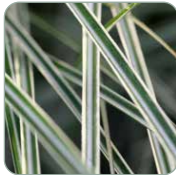
Miscanthus sinensis Morning Light 'Elefantgræs' Højde: 120-150 cm Blomstrer sjældent Fuldt vinterhårdfør