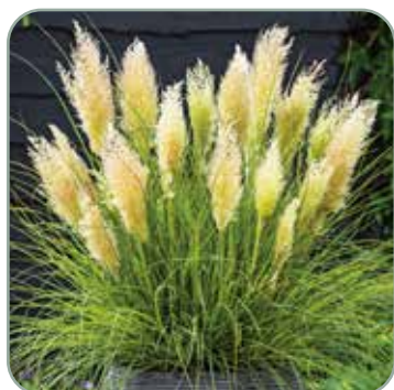
Cortaderia Tiny Pampa 'Pampasgræs'

Højde: 100 cm Blomstrer august - oktober Skal vinterdækkes