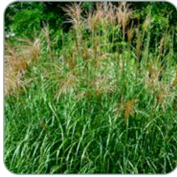
Miscanthus 'Adagio' 'Elefantgræs' Højde: 80-100 cm Blomstrer august - oktober Fuldt vinterhårdfør