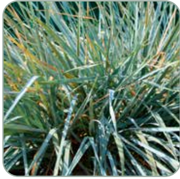
Leymus arenarius Blue Dune 'Marehalm' Højde: 50-100 cm Blomstrer juni - juli Fuldt vinterhårdfør