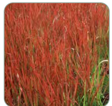
Imperata Red Baron 'Blodgræs'

Højde: 20-25 cm Blomstrer juni - juli Fullt vinterhårdfør