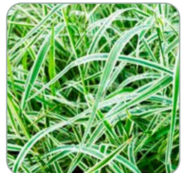
Carex morrowii 'Variegata'

Højde: 40 cm Blomstrer sjældent Fullt vinterhårdfør