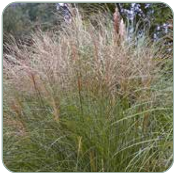
Miscanthus sin. Kleine Silberspinne 'Dværg Elefantgræs' Højde: 80-100 cm Blomstrer september - oktober Fuldt vinterhårdfør