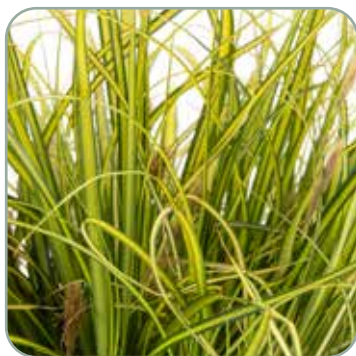
Carex oshimensis Eversheen

Højde: 40 cm Blomstrer juni - juli Skal vinterdækkes